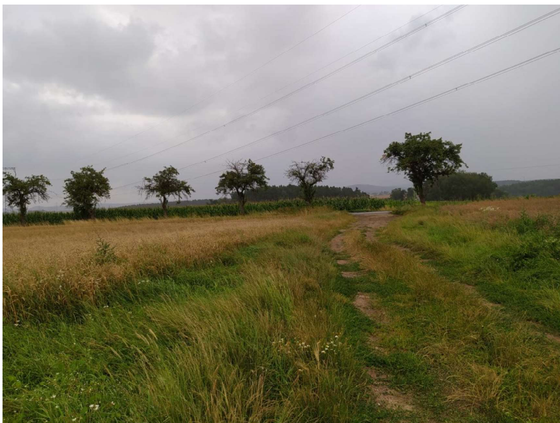
Pohled na TEO 4 v km 0,050 a sjezd na silnici III/19342 – proti směru staničení