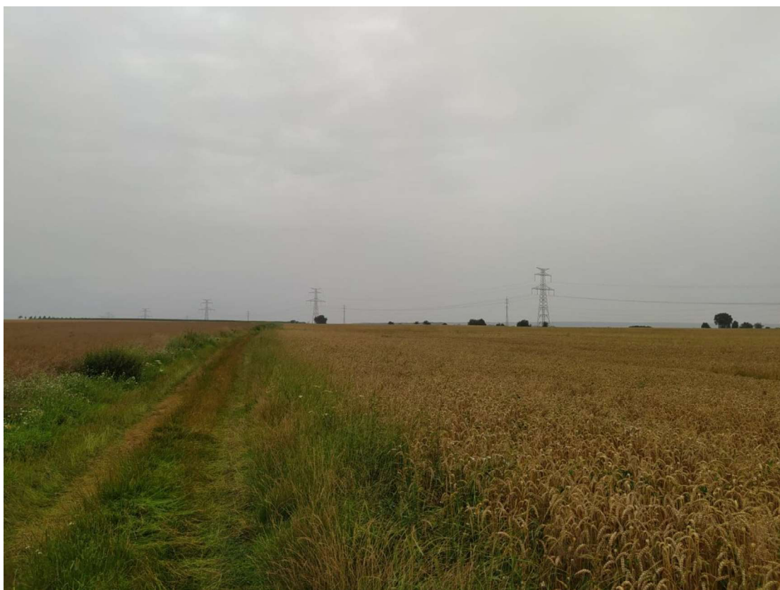
Pohled na TEO 4 v km 0,320 – po směru staničení