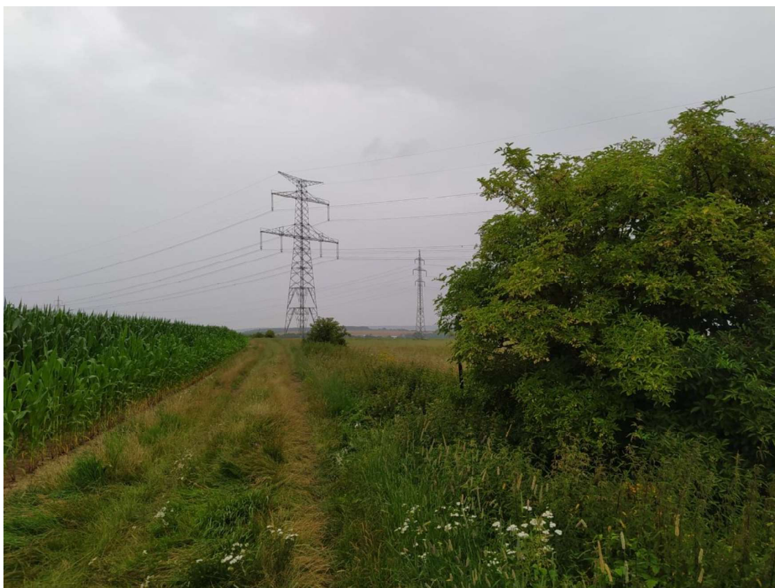
Pohled na TEO 4 v km 0,850 – po směru staničení