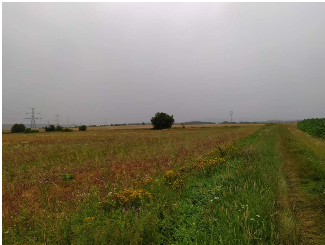
Pohled na TEO 4 v km 0,850 – proti směru staničení